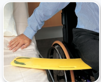
Ayudas de enfermería SAMARIT

Descargue su idioma de nuestro sitio web o consulte a su distribuidor local.