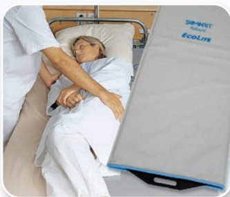
SAMARIT Rollbord ECOLite