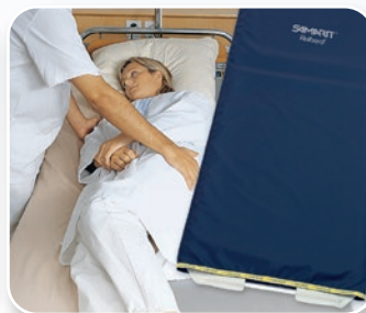
SAMARIT Rollbord H-Line